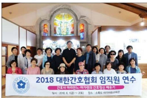
대한간호협회가 마리안느와 마가렛 간호사의 정신을 배우는 임직원 연수를 소록도에서 실시했다.